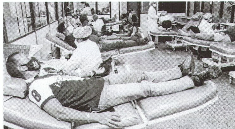
AMBULATÓRIO para pacientes hematológicos no PA

No dia 16 de junho, menos de um mês depois de atingir a triste marca de um milhão de casos de Covid-19 confirmados, o Brasil atingiu a marca de mais de dois milhões de infectados